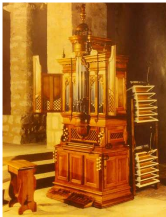
Orgue Création "Olivier Chevron, 2000

Les plus gros instruments possèdent au moins cinq claviers, plus de 100 jeux pour plus de 10 000 tuyaux. Pour autant l'ancêtre de l'orgue était très rudimentaire.